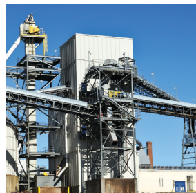
Materiaalin- käsittely ja kuljettimet