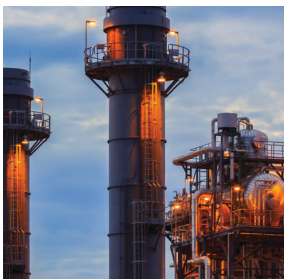
Energia ja voimalaitokset

Toimialastasi riippumatta olemme aina lähellä ja palvelemme sinua yksilöllisesti ja joustavasti. Toimintavarmuutemme helpottaa myös yrityksesi riskinhallintaa, saat oikeat osaajat oikeaan aikaan.