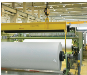
Prosessiteolli- suuden koneet ja laitokset